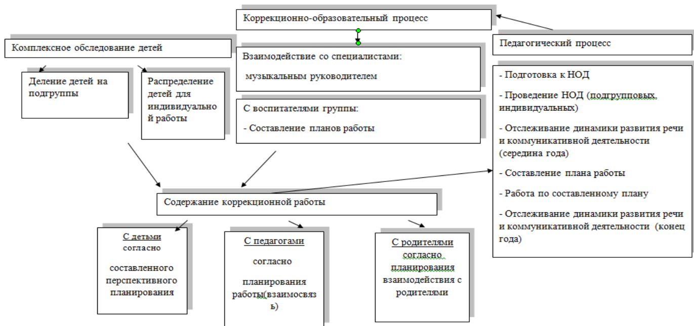
Схема организации работы учителя-дефектолога